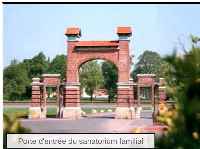
Porte d'entrée du sanatorium familial