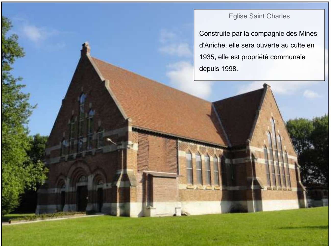
Eglise Saint Charles

Elle conserve une dalle funéraire ornée de blasons du XVIème siècle ainsi que des fonts baptismaux de 1683.