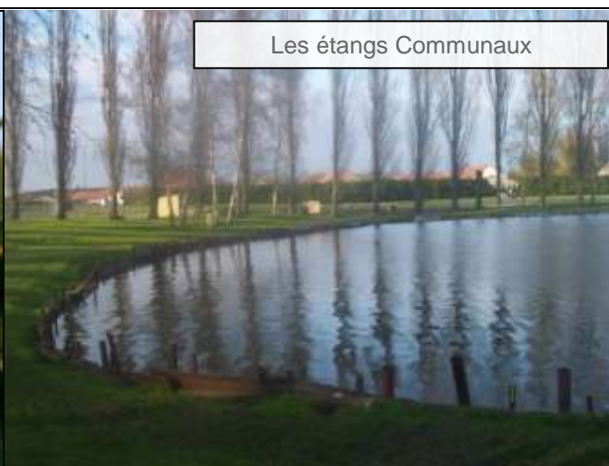
Les étangs Communaux