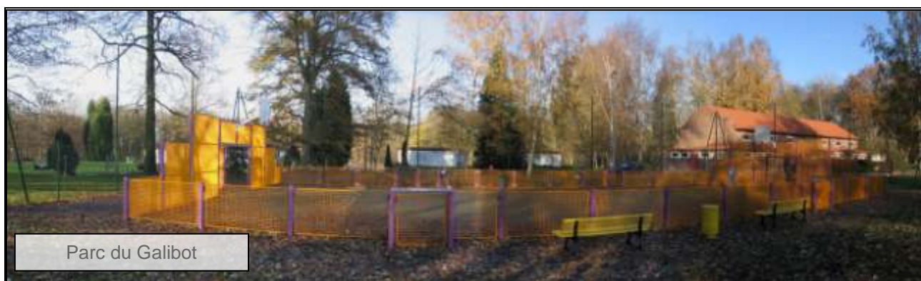
Parc du Galibot